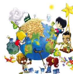
EDUCACION AMBIENTAL: Perspectiva integradora naturaleza, sociedad y cultura

Este es un boletín que edita periódicamente la Secretaría de Educación de la CTERA como una contribución al debate político pedagógico de nuestros tiempos.