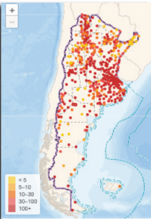
Casos confirmados por Departamento. Confirmados por cada 100.000 habitantes.

La Tasa de Letalidad es la relación entre casos fallecidos y casos totales. Es un parámetro a tener en cuenta cuando se analizan los datos. Hay un incremento de esta tasa: el 8 de septiembre era de 2,075584981, el 9 de octubre de 2,651894218 y al 18 de octubre de 2,7486415, esto indica que además de las camas UTI disponible es necesario evaluar la Tasa de Letalidad.